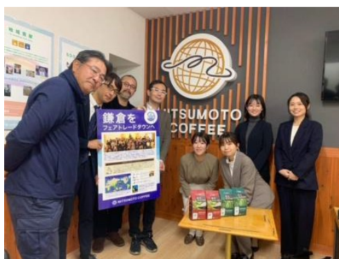
三本珈琲、鎌倉エシカルラボ、国分首都圏、 3社の共創メンバー