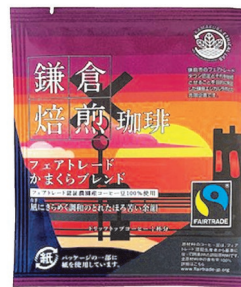
鎌倉の情景をデザインにした個包装