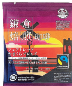
鎌倉の情景をデザインにした個包装