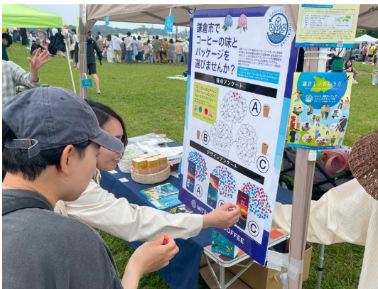
投票で味わいとパッケージデザインを決定

同商品を通じて、小売店等の流通業界、生活者の皆さまに社会や環境に配慮した商品に関心を持っていただき、鎌倉市のフェアトレードタウン認定の取り組みを支援するとともに、売上げの一部を鎌倉市の緑地保全基金へ寄付を行うことで、歴史的文化遺産と結びついて鎌倉市内に分布している緑地を後世に引き継ぎ、環境を保全することに寄与します。さらに生産者の生活と自立を支援し、地球温暖化によるコーヒー豆の栽培地が減少すると警鈴がならされている2050年問題への対策にも貢献いたします。