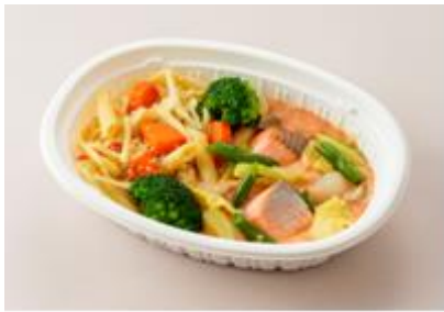
「囃む」サーモンと雑穀のショートパスタ 豆乳トマトソース 289kcal 野菜量 127g