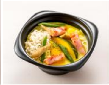
かぼちゃとベーコンの とろーり豆乳ポタージュ 221kcal 野菜量 81g