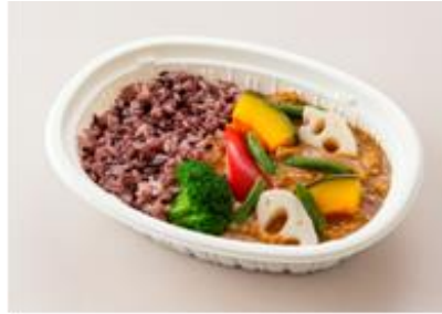
トマト仕立てのピリ辛スパイスカレー 480kcal 野菜量 126g